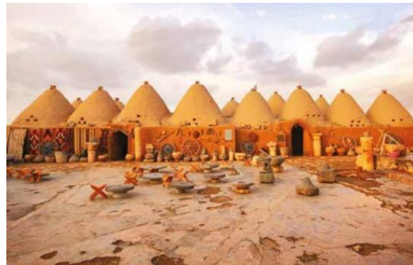
Resim 6: Harran Evleri, Şanlıurfa

Kerpiç evlerin günümüzdeki kullanımlarından bazı örnekler şu şekillerde görülmektedir; Harran evleri günümüze kadar gelmiş önemli örneklerden biri olarak bilinmekte ve bu evlerin günümüzdeki kullanımı farklı biçimlerde görülmektedir. Bunun yanında evlerin iç kısmında yöresel Urfa elbiseleri, sarıkları, süs eşyaları izleyiciye sunulmaktadır (Resim 6). Malatya geleneksel evleri ise 2017 yılında tamamlanmış olup içerisinde müze, radyo binası, sergi alanı ve Turgut Özal anı evi bulunmaktadır. Bu evler günümüzde faaliyete geçmiş durumda faaliyet gösteren geleneksel mimari örneklerdir (Resim 7). Safranbolu evleri ise mimari yapı bakımından büyük oldukları görülmektedir. Kerpiç evlerin büyüklüğünün sebebi ise Safranbolu da ki geniş aile yapısı olduğu bilinir. Safranbolu evleri günümüzde konuk evi, otel, müze vb. gibi amaçlarla kullanıldığı görülmektedir (Resim 8). Kerpiç ev yapılarından meydana gelen Sonsuz Şükran Köyü’nün kuruluş amacı ise faaliyetlerini yürütebilmeleri için sanatçılara, arkeologlara, yönetmenlere, yazarlara sunulmuştur (Resim 9).