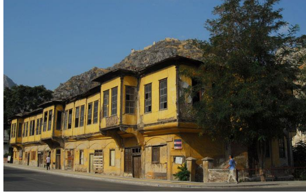
Resim 5: Amasya Evleri, Amasya

(Amasya evleri 24.03.2018 https://www.google.com.tr/searchbiw )