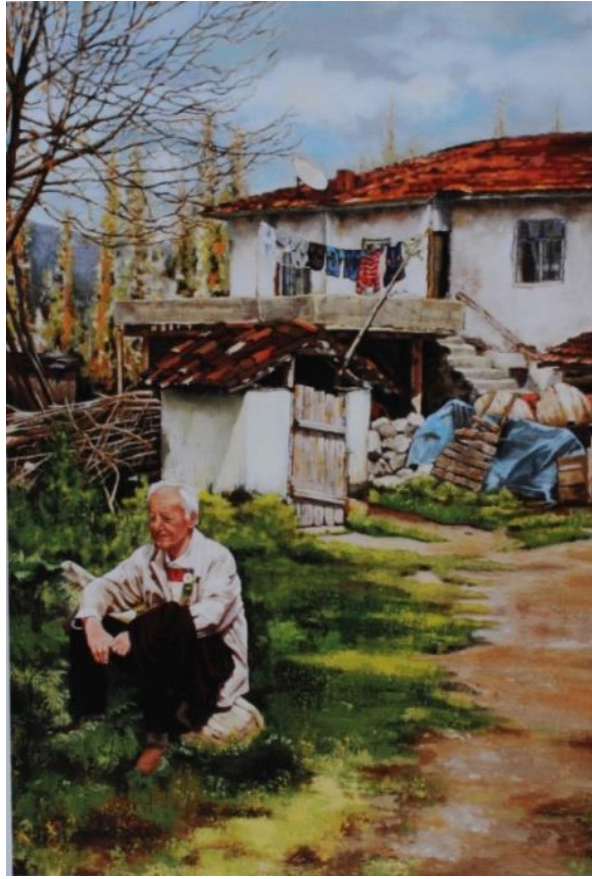
Resim 14: Hülya Çalık, “İsimsiz”, 1940, Tuval üzerine yağlıboya, 90x130 cm