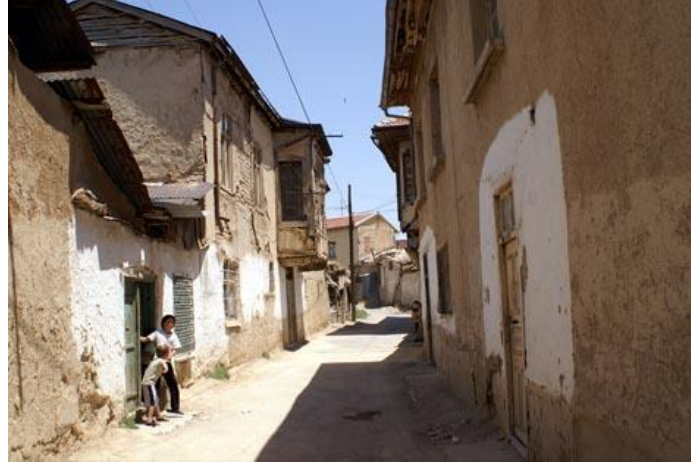
Resim 3: Karaman Merkez Mahallesi Evleri, Karaman ( httpwww.karamaninternet.com )