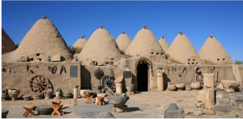
Resim 1: Harran Evleri, Şanlıurfa

Bu tahribin sebepleri düşünüldüğünde Kültürel bilinçsizlik, iklimsel nedenler, doğal afetler, baraj ve benzeri projelerle su altında yapıların kalması, mimari, sanat eseri ve tarihi belge niteliğindeki evlere dönemin yöneticileri ve mimarların yeteri kadar önemli bir konumda tutmayışı bu tahribatın sebepleri arasında sayılabilir.