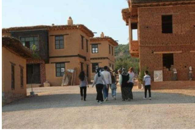
Resim 9 : Hüyük Sonsuz Şükran Köyü, Konya

( http://www.emlakeki.comunlu-sanatcilar-bu-koyden-ev-aliyor-haberi-20870 )