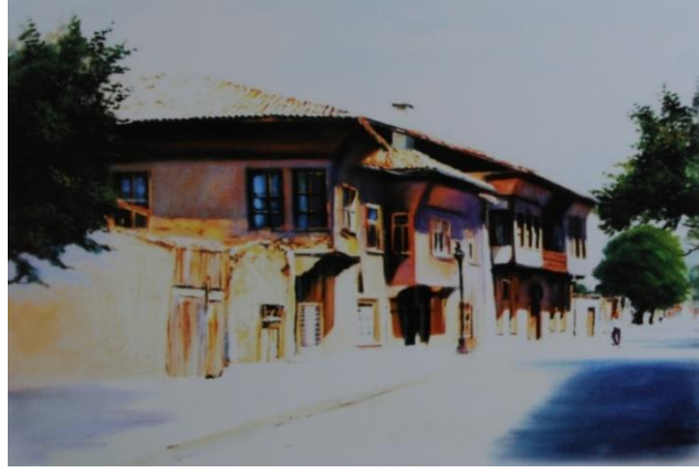
Resim 11: Şahin İmer, “Konaklar”, 1940, Tuval üzerine yağlıboya, 50x70 cm (Demirbağ, 2012: 181)