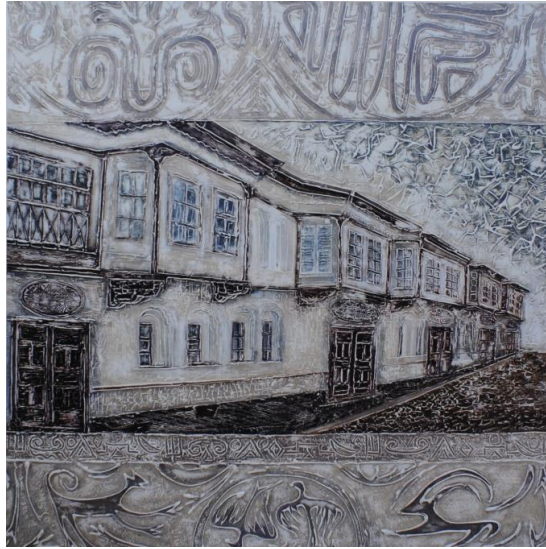
Resim 13: Fehmi Kolçak, “Beş Konaklar”, tarih, tuval üzerine karışık teknik, 120x120 cm