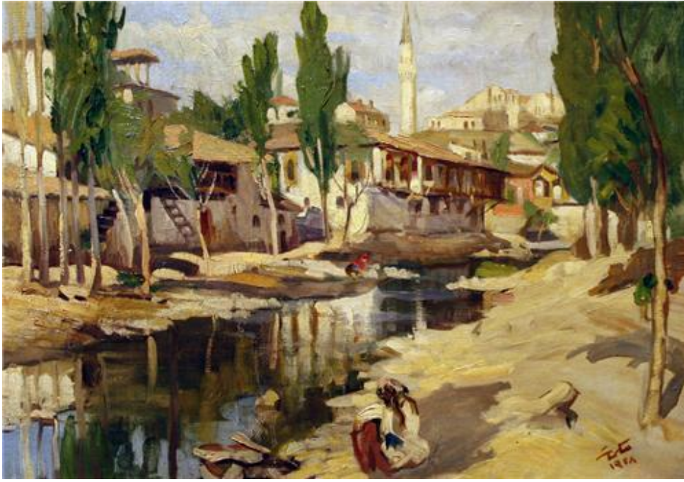
Resim 10 : Hikmet Onat, “Ankara’dan”, 1928, tuval üzerine yağlıboya, 51,5 x 72cm