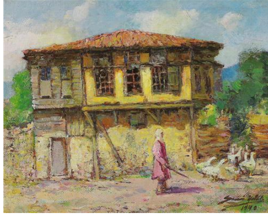
Resim 11 :Sami Yetik, “Zekeriya köyü”, 1940, Duralit üzerine yağlıboya, 37x47 cm

Sami Yetik birçok savaş konulu resimde yapmış, kurtuluş savaşını ve halkımızın mücadelesini konu edinerek duyarlılığın da ortaya koymuştur. Resimlerinde halkın yaşam biçimini ortaya koyan temaları resmetmiştir. Resimleri durağan değil hareketlidir. Hareketli resimlere örnek olarak bir savaş sahnesi yada yukarıda resim 11 de görüldüğü gibi kazları yönlendiren figür örnek gösterilebilir. Resimlerde empresif bir etkinin yanında pastelimsi bir boya sürme etkisi de görülmektedir.