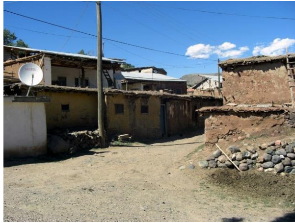
Resim 4: Güvenç Köyü Evleri, Malatya ( httpmapio.netpicp )