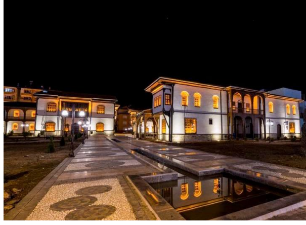
Resim 7: Malatya Geleneksel Evleri, Malatya