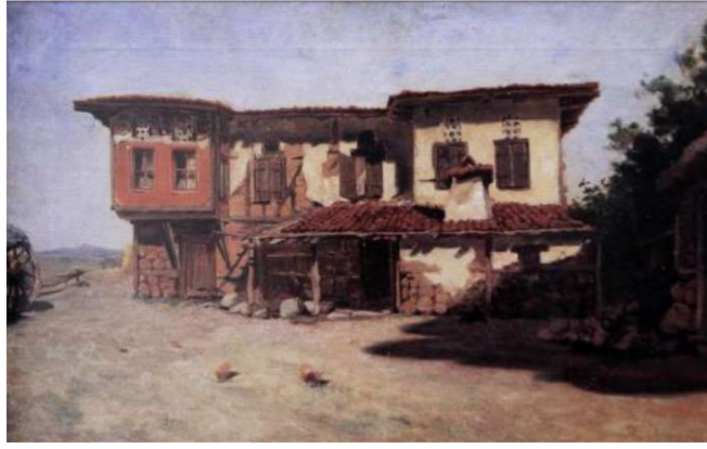
Resim 12: Süleyman Seyid, “Köy Evi”, tarihi bilinmiyor, tuval üzerine yağlıboya, 43,5x61 cm