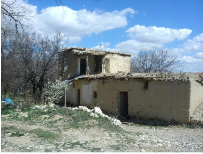
Resim 2: Kadıbrahim Köyü Evi, Malatya