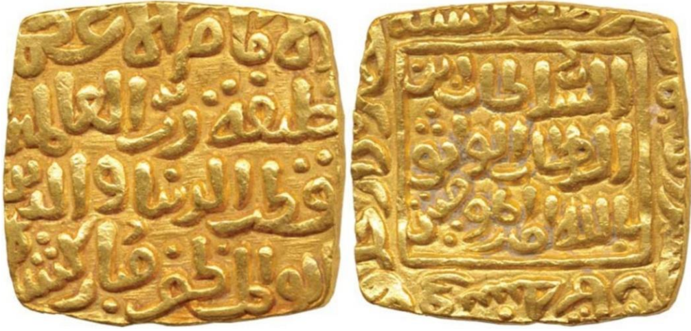
Kutbeddin Mübârekşah Halacî'nin "halife" ünvanlı parası (altın tenge).