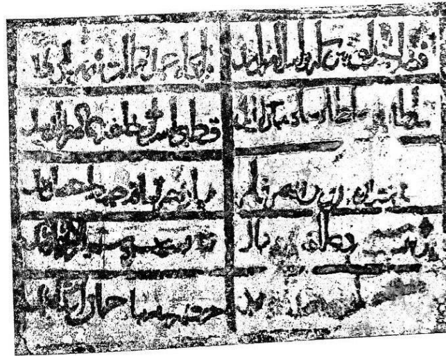
(b) Inscription in a mosque in Dakhni Tola, Bhuli (Mirzapur).