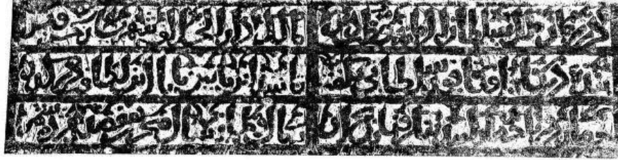
(b) Inscription on the south-east doorway of the Jhalar Baoli, Bayana.