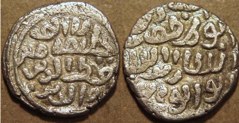
Kutbeddin Mübârekşah Halacî'nin "halife" ünvanı taşıyan gümüş parası (tenge)i.