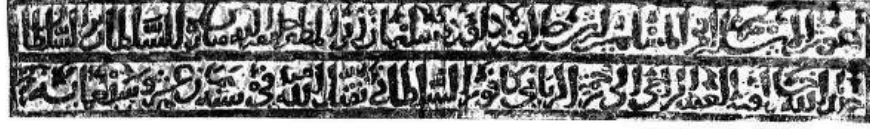
(a) Inscription on the north-east doorway of the Jhalar Baoli, Bayana.